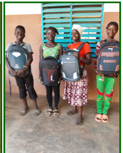
Remise des kits scolaires en septembre