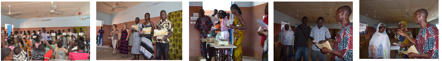
Remise de diplômes aux 24 filleuls ayant un parcours scolaire exemplaire, à 3 filleuls premier de leur classe,