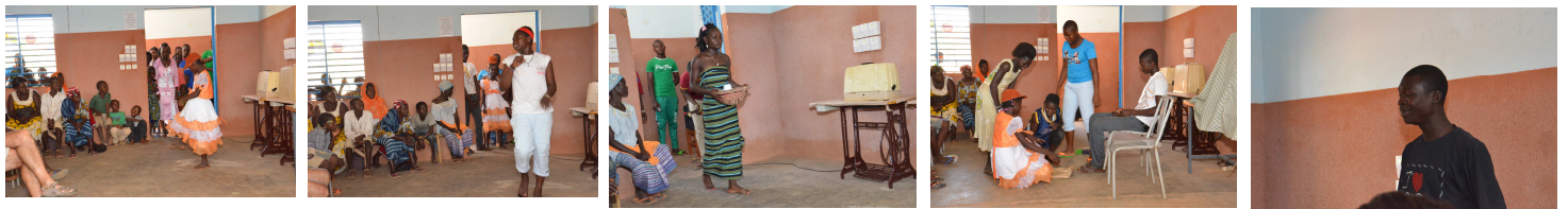
Spectacle préparé par les filleuls, de la danse, du chant, du théâtre, un défilé, très apprécié par tous,